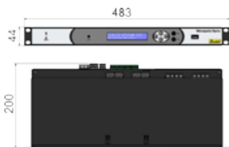
Version Rack 1U